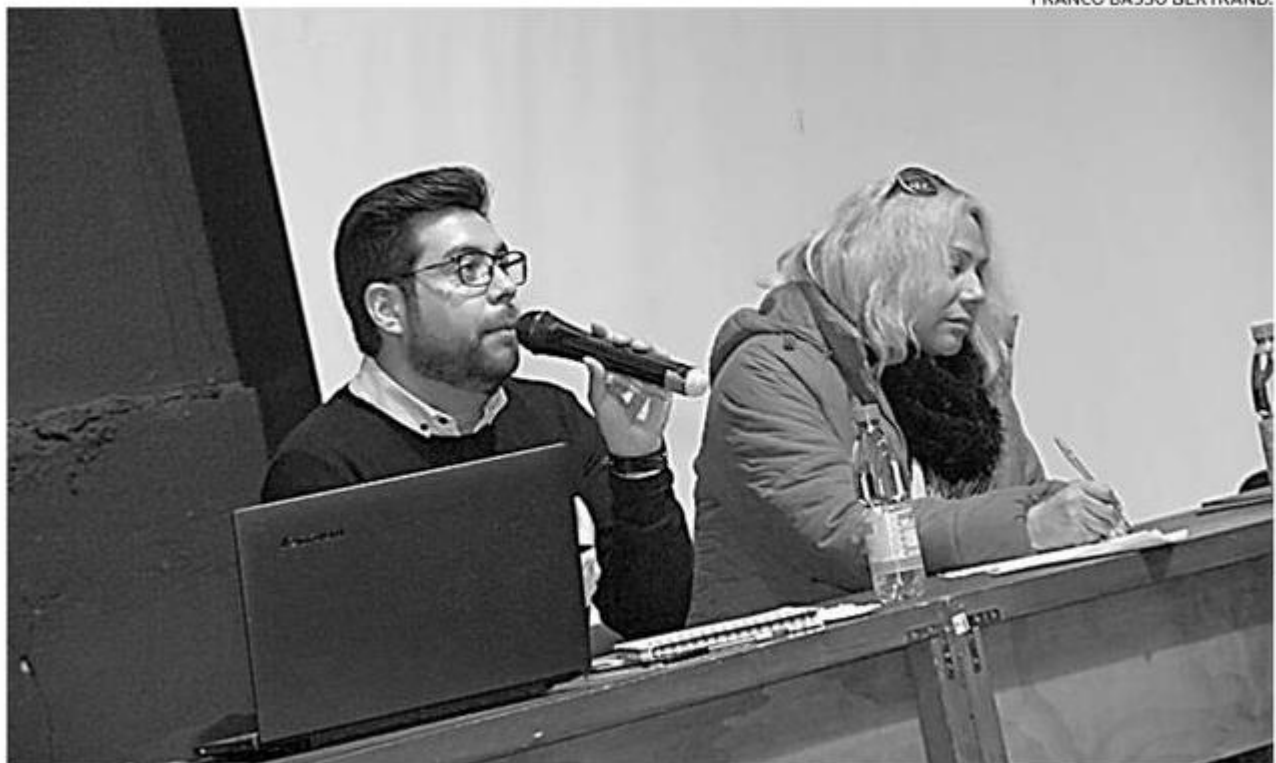
MEDIO CENTENAR DE ASISTENTES CONGREGÓ EL FORO REALIZADO EN LA CARPA DE LA CIENCIA DEL CECS.

El evento fue organizado por Valdiversa, se desarrolló en la Carpa de la Ciencia del Cecs y en él expusieron expertos en la materia. (Diario Austral)