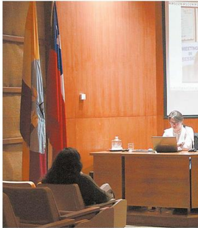
DURANTE LA JORNADA DE AYER FUE DESARROLLADA LA CLASE MAGISTRAL "PREFERENCIA Y DIVERSIDAD SE-

DURANTE UN MES. Ciclos de cine, coloquios y clases magistrales son algunas de las actividades que desarrollará en agosto la casa de estudios, para analizar los avances y desafíos en equidad, que existen tanto al interior de la institución, como en el territorio de Los Ríos.